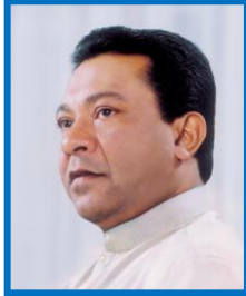
Hon. S.B.Dissanayake Minister, Ministry of Social Empowerment, Welfare and Kandyan Heritage.

I am delighted to send this message of felicitation to the National Conference on Social Work for Poverty Reduction & Sustainable Development (NCSW - 2017). As the National Institute of Social Development (NISD) is the educational arm of the Ministry of Social Empowerment, Welfare and Kandyan Heritage, the effort made by NISD to organize an appropriate academic conference under a suitable theme, is commendable.