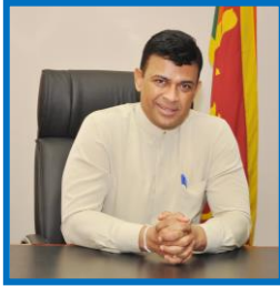
Hon. Ranjan Ramanayake Deputy Minister Ministry of Social Empowerment, Welfare and Kandyan Heritage

As the Deputy Minister of the Social Development, Welfare and Kandyan Heritage I trust empowering vulnerable community and assisting people with disabilities as well as the elders who are in need is our social accountability and responsibility. Poverty is the one of most burning issues in current Sri Lankan Social Context which is a great obstacle in heading towards the Sustainable Development. In such situation being the premier institute for Social Work Education in Sri Lanka this effort made by the National Institute of Social Development in organizing a National conference on appropriate topic for current Social context is appreciable.