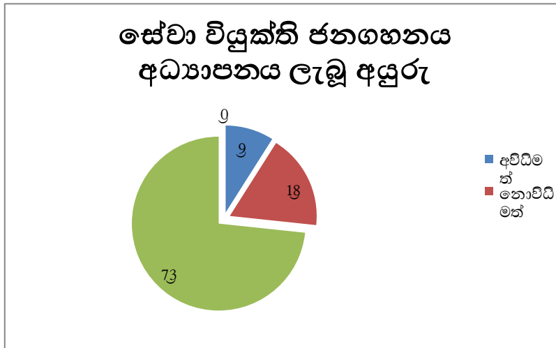
ප්‍රස්තාර සටහන 01: සේවා විද්‍යාත්මක ජනගහනය අධ්‍යාපනය ලැබූ ආකාරය

ශ්‍රී ලංකාවේ සේවා විද්‍යාත්මක ජනගහනය අධ්‍යාපනය ලබා ඇති ආකාරය කෙසේදැයි විමසා බැලිය හැක.